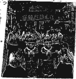
ハイチーズ パシヤ

今ここはまさに日本にある中華街です。特にここのごま団子はどの店でもおいしかったです。そして、この入口はとてもオシャレで、中華風の、鮮やかな門でした。